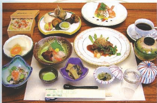
和洋会席(写真は、7,350円のプランです)