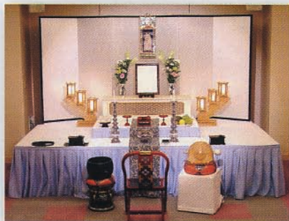
おつとめ会場 Bタイプ (写真は、35,000円のセットとなります)