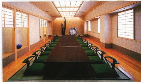
和堀ごたつ会場(24名様)