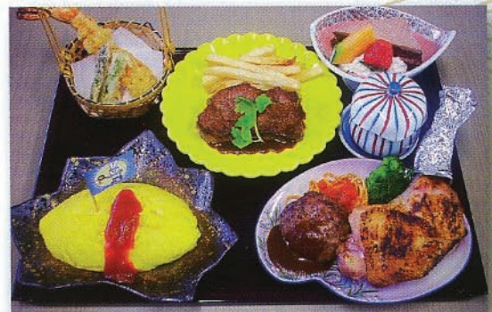
お子様お膳(写真は、3,150円のプランです)