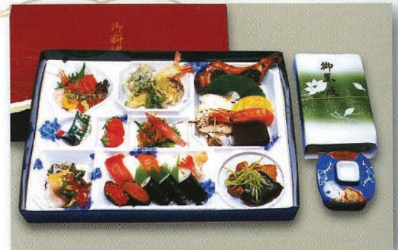
折詰和料理(写真は、6,000円のプランです)