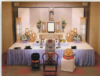
おつとめ会場 Aタイプ (写真は、50,000円のセットとなります)

時をかさねても、敬う心は変わることはありません。厳肅に、感謝の心を込めて偲ぶ。流れる時の節目に、先祖から受け継がれてきたご法要。在りし日の面影を偲び語り合いながら、やすらかなご冥福をお祈りするご法要。亡き人を縁としてつながる親しい人々と命の尊さを改めてかみしめ、心と心を結ぶひととき。古より故人を敬う心を受け継いだ、真心のご供養にふさわしいおもてなしの心を供えてお手伝いいたします。