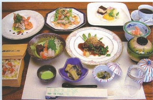
和洋会席(写真は、9,450円のプランです)