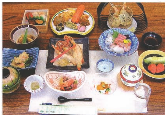
和食お膳(写真は、10,500円のプランです)