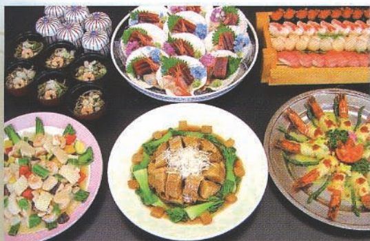
和洋中ミックス(写真は、6,300円のプランです)