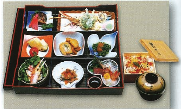
和食会席膳(写真は、4,500円のプランです)