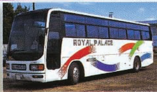
ハイデッカー車(60名乗り)