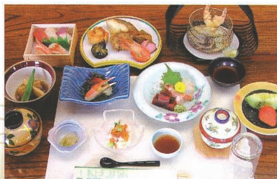
和食お膳(写真は、7,350円のプランです)