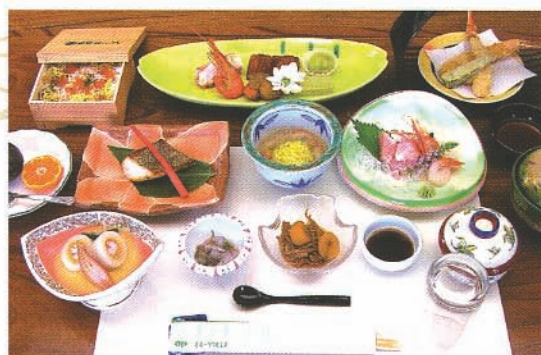
和食お膳(写真は、8,400円のプランです)